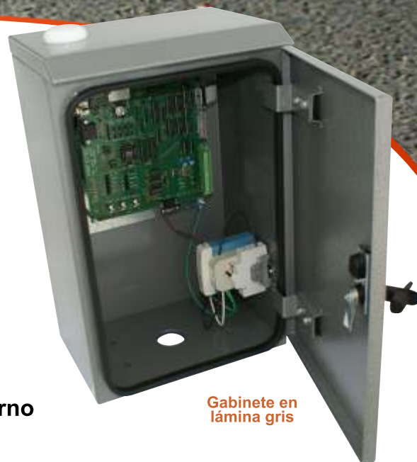
Gabinete en lámina gris