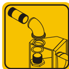
Kits de montaje