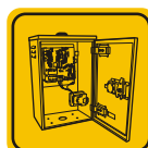
Controladores de semáforos