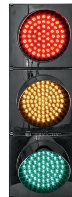
Semáforo con lámparas de 20 cm diámetro