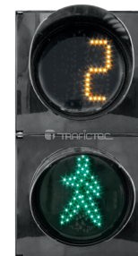
Semáforo peatonal de 20 cm